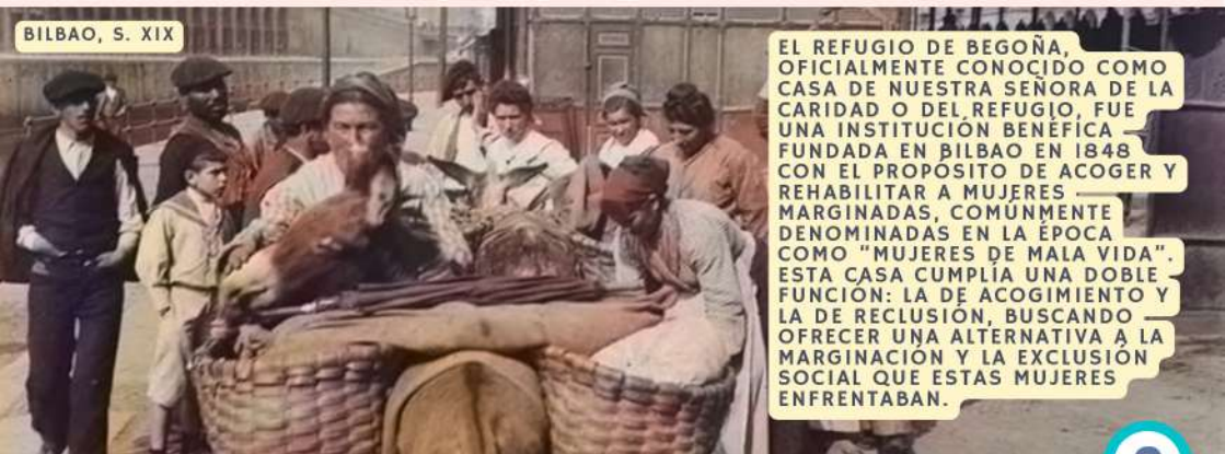
BILBAO, S. XIX

En esta virtud de la castidad, el Venerable Mariano era delicadísimo y riguroso, distintivo del sacerdote consagrado por y para Dios. Prevalecía la pureza en sus pensamientos, palabras, deseos y obras y lo manifestaba en una delicadeza de conciencia que se trasluce en los pequeños detalles de cada día